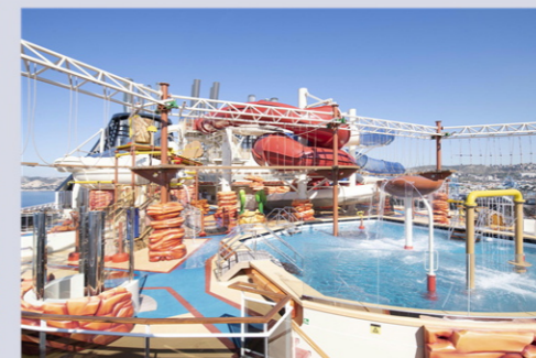
アリゾナ・アクアパーク