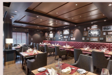
ブッチャーズカット (有料)