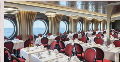
イル・チリエッジョ/ル・セリジェ