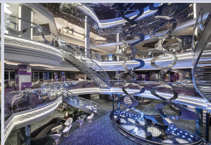
インフィニティ・アトリウム