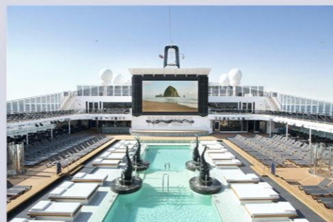
アトモスフィアプール