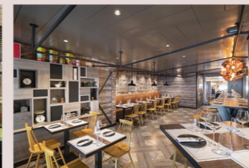
オラ!タコス&カンティーナ (有料)