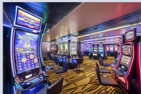
インペリアルカジノ