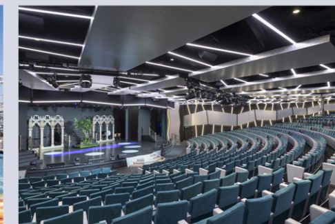
ロンドンシアター