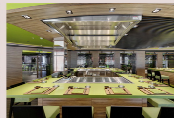
海渡鉄板焼き&寿司バー (有料)