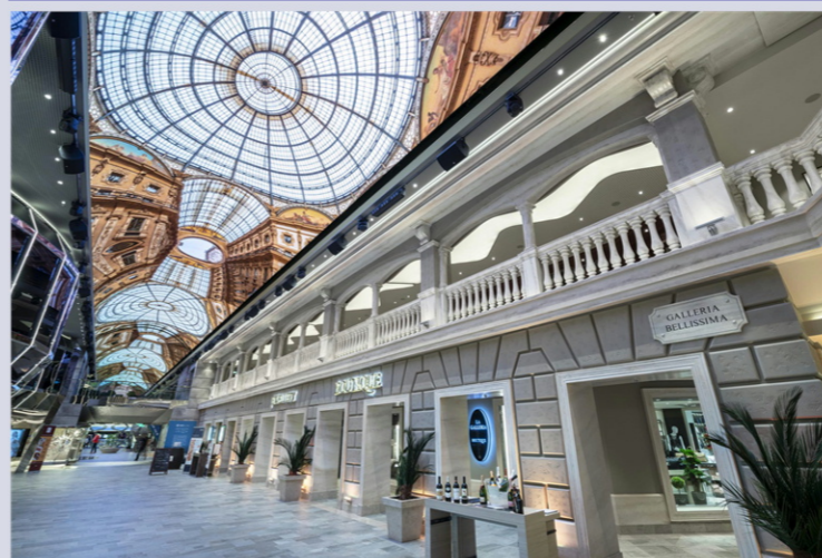
ガッレリア・ベリッシマ

24時間美しい映像が映し出されている全長80mのLEDスカイドームと、スワロフスキーの階段が美しいアトリウムは必見です。またプールサイドスペースは海の上で最もゆったりとした空間です。