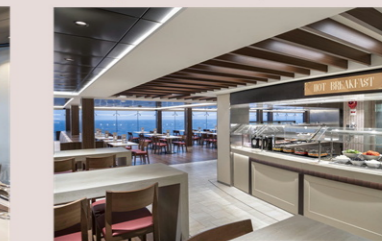
マーケットプレイス