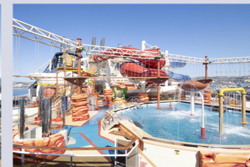
アリゾナ・アクアパーク