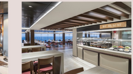
マーケットプレイス