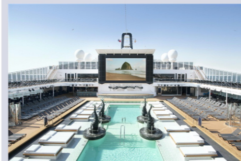
アトモスフィアプール