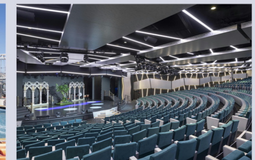
ロンドンシアター