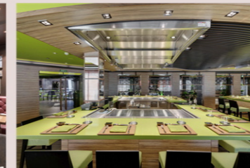
海渡鉄板焼き&寿司バー (有料)