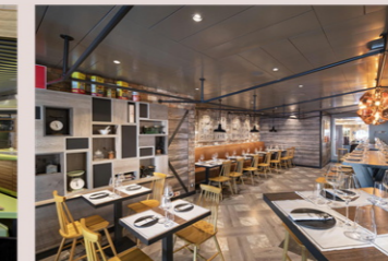
オラ!タコス&カンティーナ (有料)