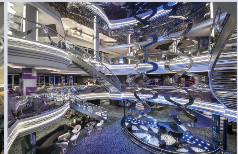
インフィニティ・アトリウム